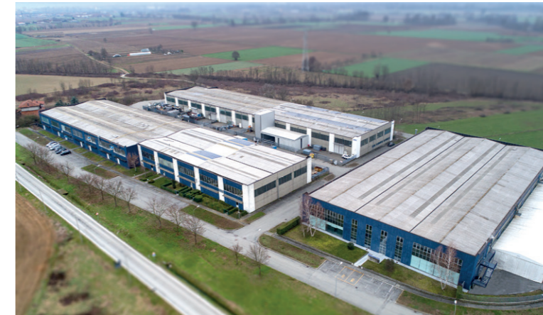
STABILIMENTI PRODUZIONE MATERASSI E LETTI PRODUCTION PLANTS MATTRESSES AND BEDS ЦЕХАПО ПРОИЗВОДСТВУ МАТРАССОВ И КРОВАТЕЙ